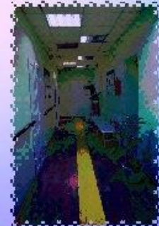
ПОРУЧНИ – НАДЕЖНАЯ ПОМОЩЬ ПРИ ПЕРЕДВИЖЕНИИ МАРКИРОВКА ПУТИ СЛЕДОВАНИЯ