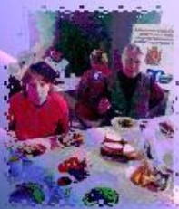
ВКУСНЫЙ ОБЕД В СТОЛОВОЙ