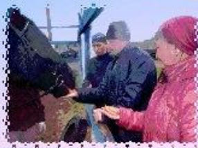
НЕЖНАЯ ЗАБОТА О ЖИВОТНЫХ