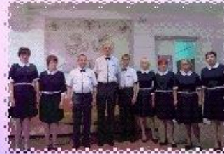
ХОР ИНТЕРНАТА «БЕРЕЗКА»