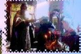
СЛОВО СВЯЩЕННИКА ЛЕКАРСТВО ДЛЯ ДУШИ