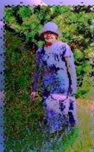
Я НЕОТРАЗИМА В СОЛНЕЧНЫХ ЛУЧАХ!