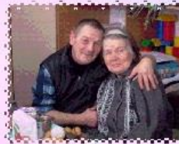
ЛЮБИ ВСЕ ВОЗРАСТЫ ПОКОРНЫ