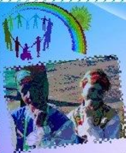
ОБЛАСТНОЙ ФЕСТИВАЛЬ «ЗАБАВА»