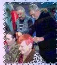
ОСВАИВАЕМ НОВУЮ ПРОФЕССИЮ