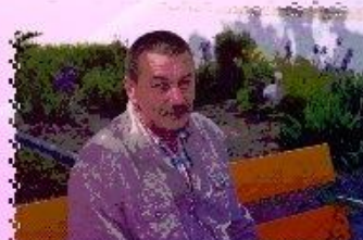
ОТДЫХ В УЮТНОМ УГОЛКЕ