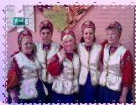
МЫ В ТВОРЧЕСТВЕ