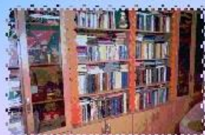
БИБЛИОТЕКА ДЛЯ ПОЛУЧАТЕЛЕЙ