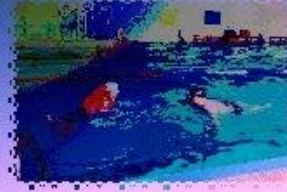
ЗАПЛЫВЫ ЗА ЗДОРОВЬЕМ