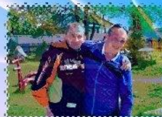
ДРУЗЬЯ, НЕ РАЗЛЕЙ ВОДА!

МЫ УМЕЕМ ДРУЖИТЬ, ЛЮБИТЬ, УЧИТЬСЯ, РАБОТАТЬ!