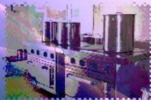
СОВРЕМЕННОЕ ОБОРУДОВАНИЕ НА ПИЩЕБЛОКЕ