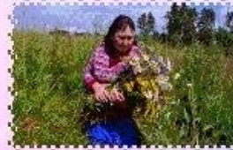
НАЕДИНЕ С ПРЕКРАСНЫМ