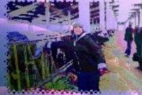
РАДОСТЬ ОТ ОБЩЕНИЯ С ЖИВОТНЫМИ