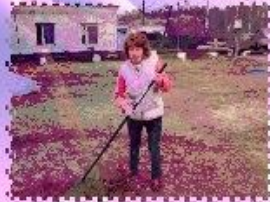
ЕЖЕДНЕВНАЯ УБОРКА ТЕРРИТОРИИ