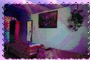
КОМНАТА ДЛЯ ПРОЖИВАНИЯ