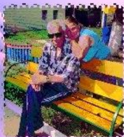
МОЙ БЛИЗКИЙ ЧЕЛОВЕК