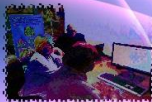
ПОВЫШАЕМ КОМПЬЮТЕРНУЮ ГРАМОТНОСТЬ