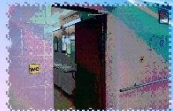
ЗНАКИ ДОСТУПНОСТИ СПЕЦИАЛЬНОЕ САНТЕХНИЧЕСКОЕ ОБОРУДОВАНИЕ В ПОМЕЩЕНИЯХ ДЛЯ ИНВАЛИДОВ