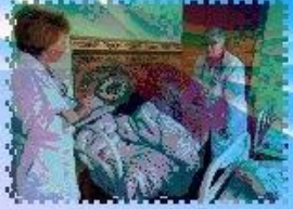
ИНДИВИДУАЛЬНОЕ ВНИМАНИЕ КАЖДОМУ