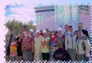
ПОЛОМНИЧЕСКАЯ ПОЕЗДКА В МОНАСТЫРЬ