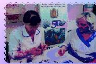
ЗА ЗДОРОВЬЕМ МЫ СЛЕДИМ