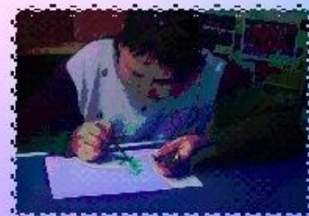
РИСУНОК СО СМЫСЛОМ