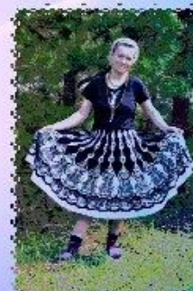
АХ, КАК Я КРАСИВА!