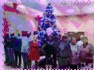
В ГОСТЯХУ ДЕДА МОРОЗА