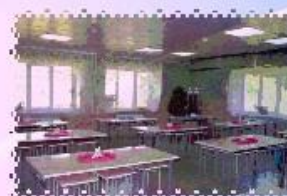
НОВАЯ МЕБЕЛЬ В СТОЛОВОЙ