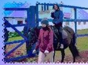
НЕВОЗМОЖНО СКРЫТЬ ПРУЖИНЫЕ ЭМОЦИИ